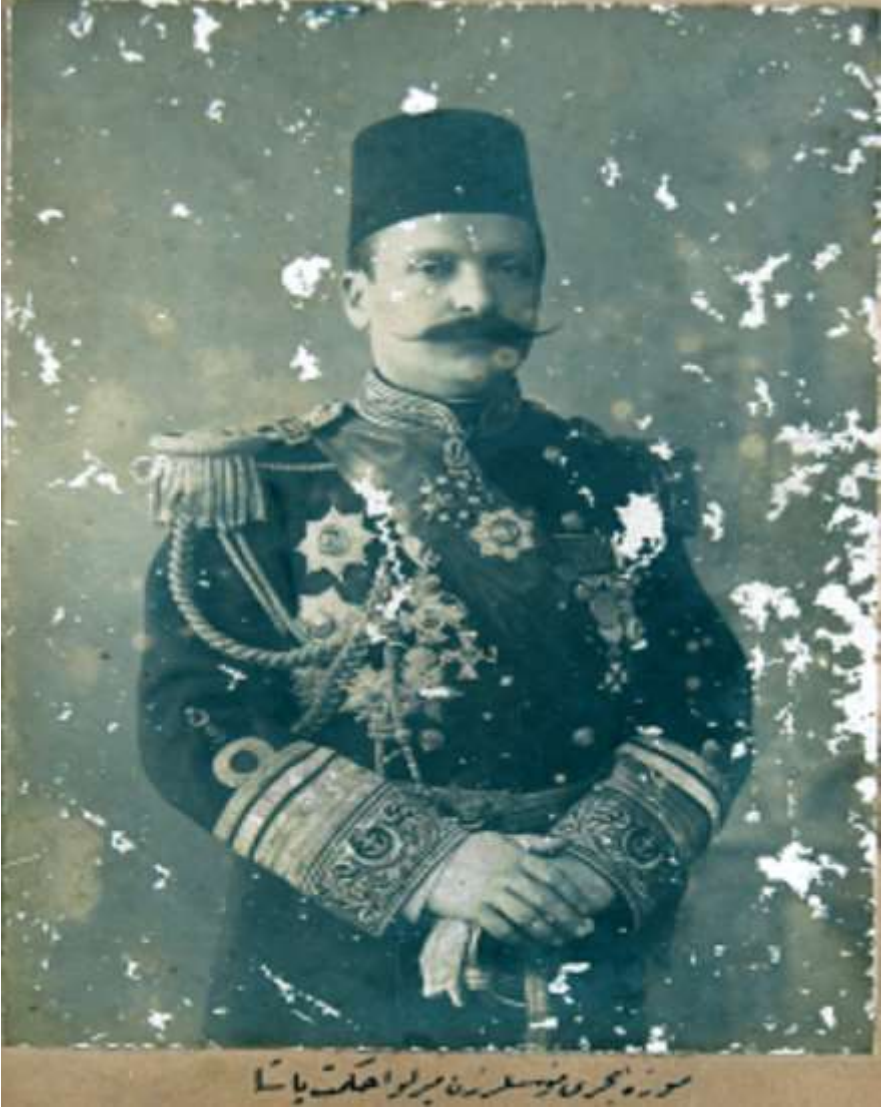
EK-4: Mirliva Hikmet Paşa'nın Bir Fotoğrafı. Fotoğrafın altında "Müze-i Bahrî Müessislerinden Mirliva Hikmet Paşa" yazısı bulunmaktadır. (Kaynak: Deniz Müzesi Fotoğraf Arşivi, Nu: AA.606).