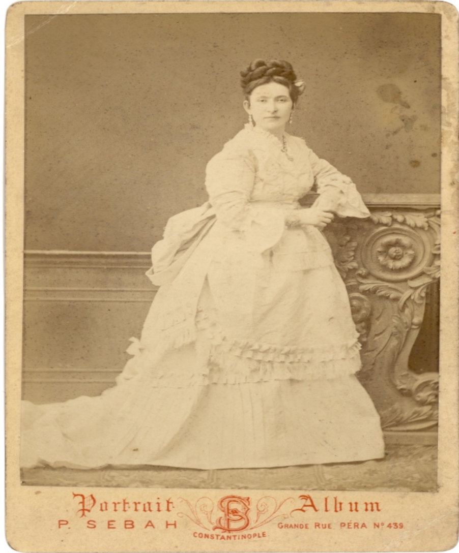
EK1: Saliha Sultan