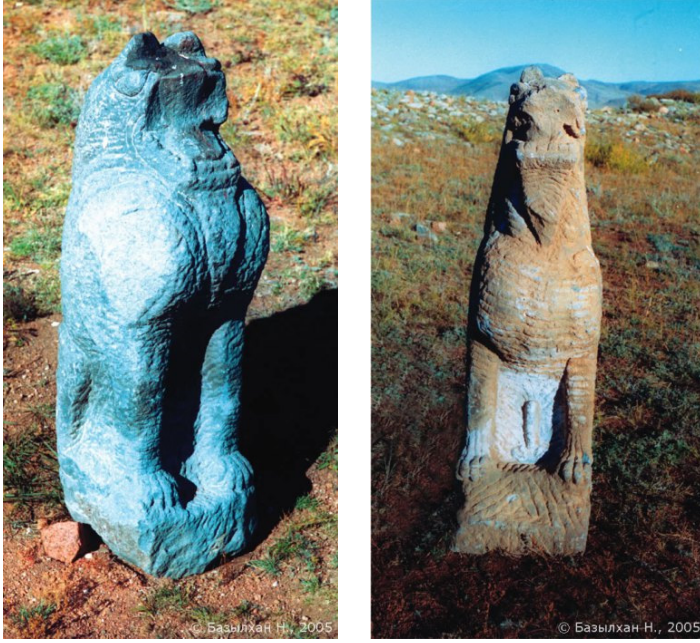
RESİM 3: Şivet Ulan Külliyesi'nde bulunmuş arslan heykel kalıntıları