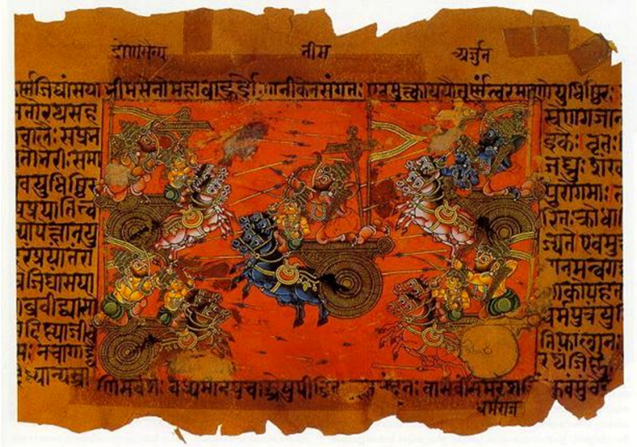
RESİM 1: Kuruşektra Savaşı ile İlgili Minyatür

Hintlilerin eski çağlardaki yaşamını anlatmanın yanı sıra özellikle siyaset, bilim ve toplum hukuku açısından önemli eserlerden birisi de Aşoka'nın büyükbabası Maurya kralı Candragupta (M.Ö. 323-298)'nın bakanı olarak bilinen Kautilya 'nın yazdığı düşünülen Arthaşāstra ("Yönetim ve siyaset el kitabı")'dır. 15 Arthaşāstra'ya göre hükümdar, tanrılarla birlikte kraliyet kalesinin ortasında yer alırken yönettiği dört sınıftan brahmanlar kuzeyde, kṣatriyalar doğuda, vaiśyalar güneyde ve sudralar batıda olmak üzere dört ana yönde yerleşmişlerdir. 16 Tekerleğin merkezinde hareketsiz olarak kalabilen "dünya hükümdarı" çakravartin ise kast sisteminin dışında, yani atīvārna 'dır.