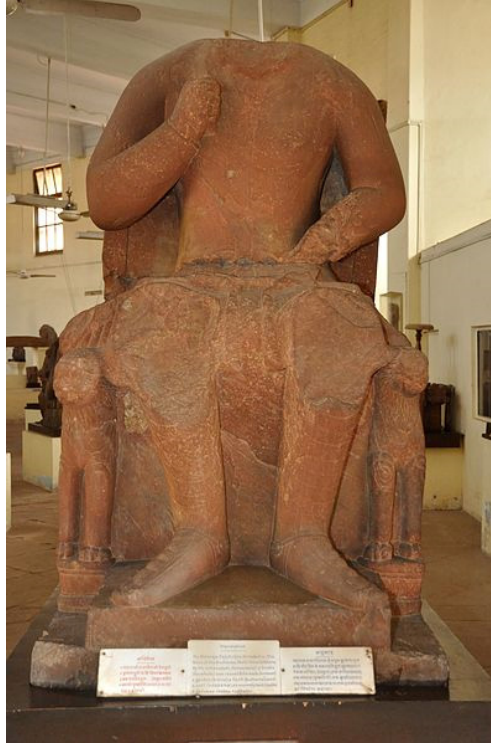
RESİM 2: Aslanlı Tahtta Oturan Kuşan İmparatoru Vima Kadphises, Matura, M.Ö. I. Yüzyıl, Matura Hükümet Müzesi

Budizm, Hindistan tarihinde Kuşan döneminde, özellikle M.S. II. yüzyılda Kral Kanişka'nın hükümdarlığı devrinde ikinci kez büyük derecede himaye görmüştür. Kuşan döneminde Güneş Tanrısı Surya 'ya verilen önem ve Kuşan sanatında neredeyse Surya ve Kuşan hükümdar tasvirlerinin birbirlerinden ayırdedilemeyecek kadar benzer olması çok dikkat çekicidir. 24 Surya, genellikle atlar tarafından çekilen bir arabada veya iki yanında atlar veya bazen aslanlar bulunan bir tahtta otururken resmedilmiştir. Simhasana olarak adlandırılan arşanlı taht ise, Matura şehrinde bulunan Vima Kadphises heykelinde olduğu gibi Kuşan hükümdarları tarafından sıkça kullanılmıştır. Her hükümdarın simhasana'ya sahip olamayacağı ve bu tahtın sadece çakravartinler tarafından kullanılabilceğini 25 hatırlatmak gerekir (Resim 2).