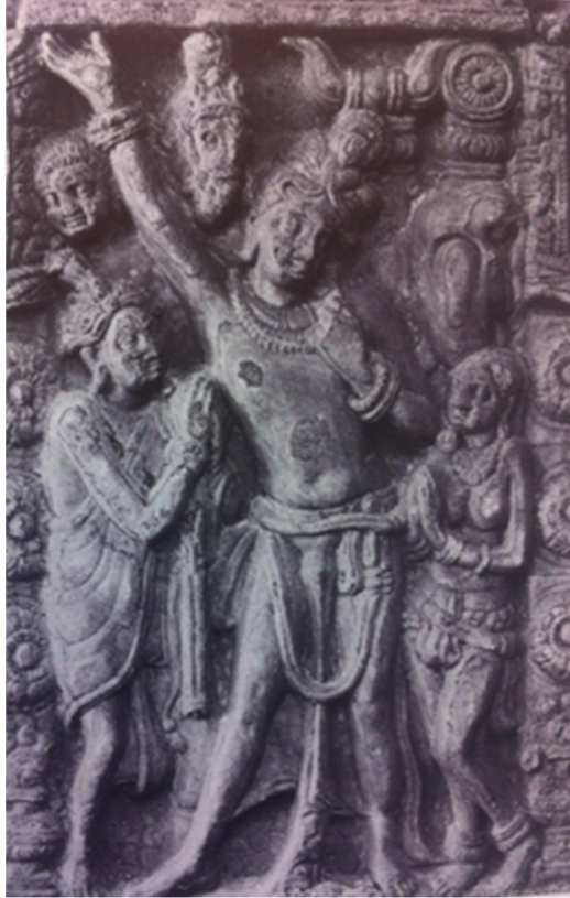
RESİM 6: Çakravartin ve Yedi Cevheri, Kuşan Dönemi Stupa Plakası, Nagarjunikonda (Rosenfield 1965, Fig. 159)

çakravartin'in görevlerini yerine getirmesi gerektiğini göstermektedir. Genç kral bunu yerine getirdiğinde oruç günü (ayın 15. günü) tekerlek, binlerce tekerlek parmağı, eksen ve kenarları ile görünür. Kral sol eline kutsal su ile dolu kabı alır, suyu sağ elindeki tekerleğin üstüne serper ve “ kutsal tekerlek harekete geçsin ve zafer dolu akışımı bulsun! ” der. Tekerlek, kuzey, doğu, güney, batı yönlerinde dönmeye başlar; böylelikle kral ordusu ile birlikte bütün dünyaya dharma'yı yayar ve hâkimiyeti altına alır. O zaman tekerlek saraya döner ve dünya kralının işaretleri olarak yatak odasının kapısının üzerinde asılı kalır. Eğer kral görevlerini yerine getirmez ise dünya bir çok tehlikeye maruz kalacaktır. 117