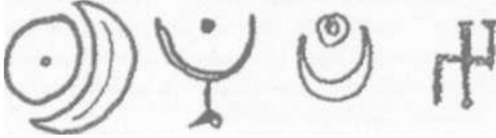
RESİM 5: Türklerde kün-ay sembolleri (Esin 2001)

önemli dinî törenlere başkanlık etmesi sebebiyle din işlerinde de en üst makam olarak görünen Türk hükümdarı, Tanrı'nın verdiği iktidar yetkisi kut ile doğru yönetimi sağlamasında en büyük temeli teşkil eden ve doğru yolu gösteren töreyi bünyesinde birlikte barındırdığı sürece dünyaya hükmedecektir. İşte bu nedenle yüzyıllar boyunca gerek Batı, gerek Doğu Türkleri'nde ortak olarak görülen kün ay motifi , Türk devlet telâkkisinin bu durumunun en büyük alâmeti olarak yaşamıştır. (Resim 5)