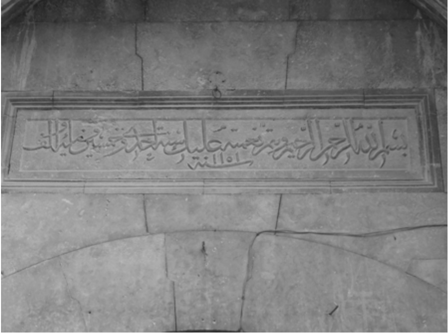
Bismillahirrahmanirrahim. Ve yütimmu ni 'metehû 'aleyke. Sene ihda ve hamsîn ve mie ve elf. (1151) 2