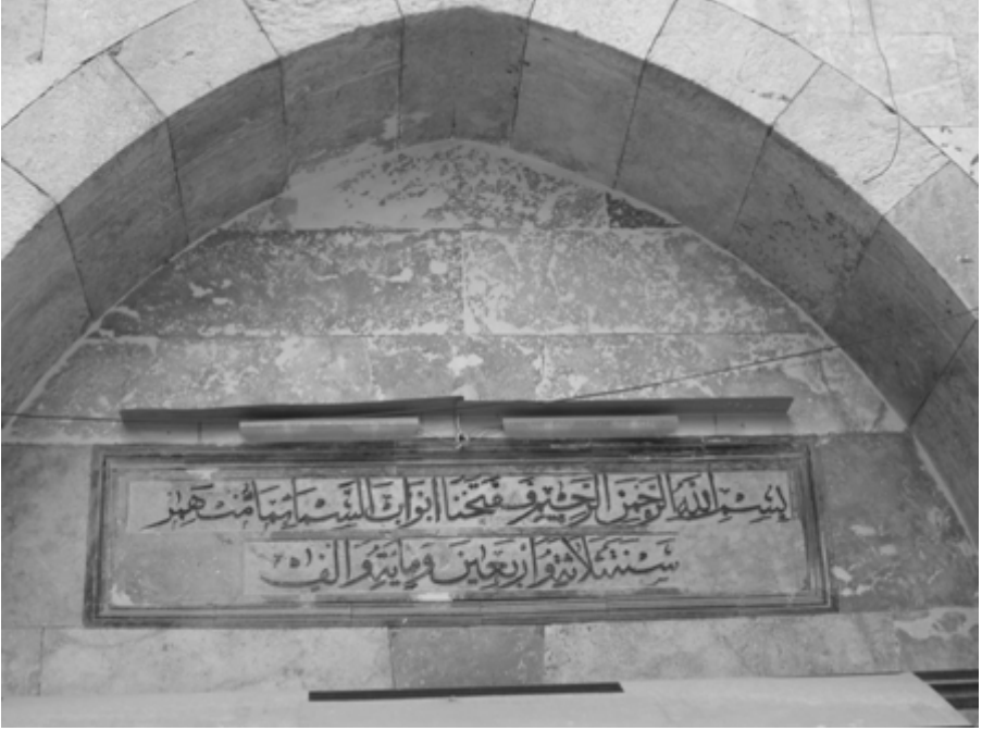
Bismillahirrahmanirrahim. Fe-fetahnâ ebvâbe 's-semâi bi-mâi münhemir. Sene selâse ve erba 'în ve mie ve elf. (1143) 3