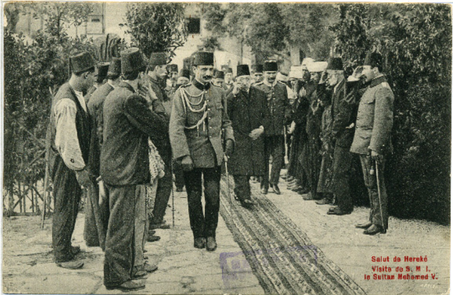
Mehmed Reşad'ın Hereke Ziyareti