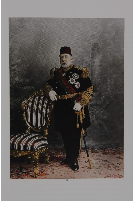
Şhzade Mehmed Reşad