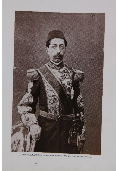
Mehmed Reşad Büyük Üniformasıyla