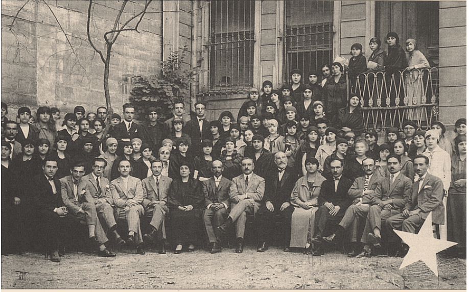
Resim VIII: 1925'te Dârülehân alafrañga ve alaturka talebe ve muallimleri bir arada.