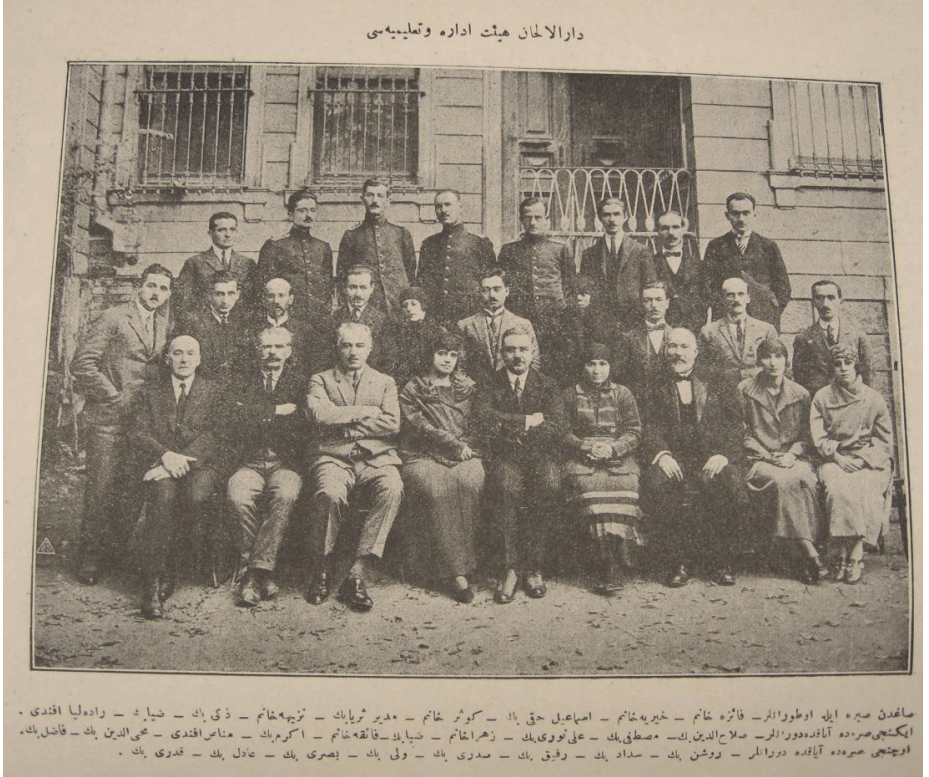
RESİM IV: Dârüelhân Heyet-i İdare ve Talimiyesi