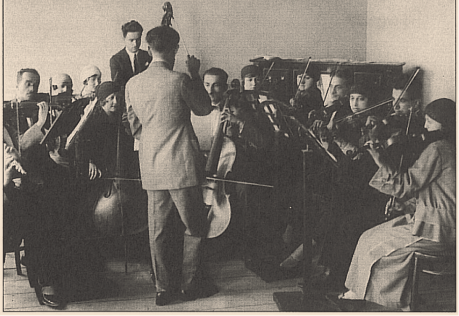
Resim VII: 1926 yılında küçük bir orkestra