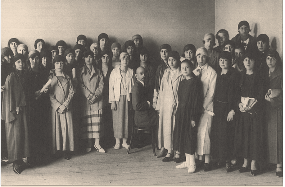
RESİM V: Dârülelhân Fasil Heyeti