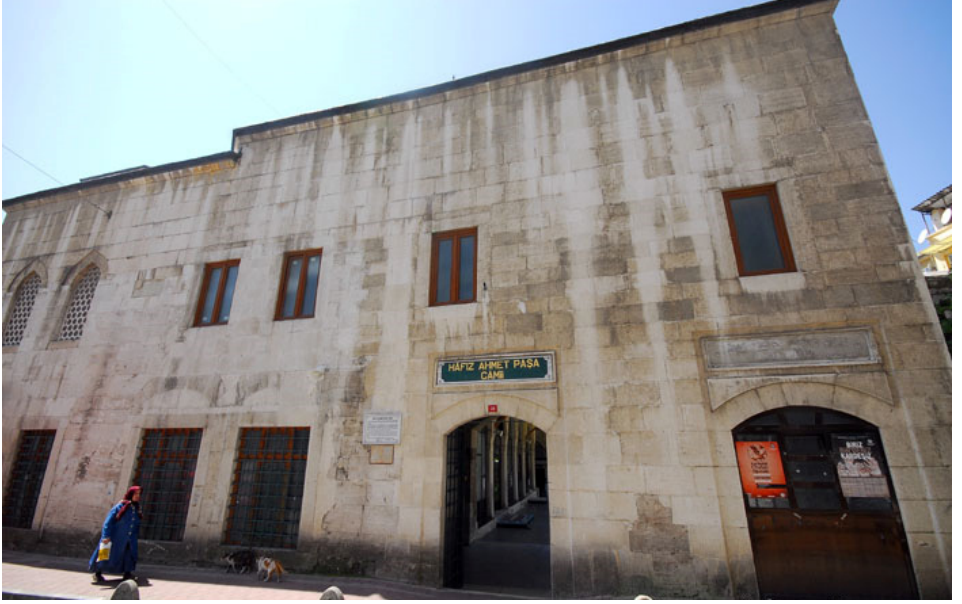
Fotoğraf 1: Hafız Ahmet Paşa Camii'nin Avluya Açılan Giriş Kapısı