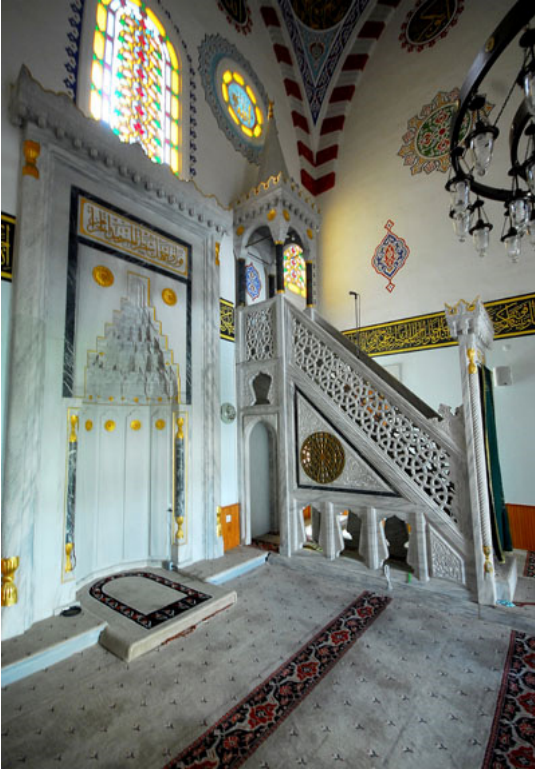
Fotoğraf 12: Hafız Ahmet Paşa Camii'nin Mermer Mihrabı ve Şebekeli Mermer Minberi