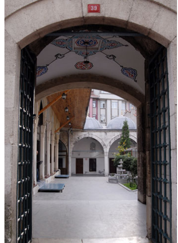
Fotoğraf 4 ve 5: Hafız Ahmet Paşa Camii'nin Medrese Odalarıyla Çevrili Avlusuna Açılan Kapı