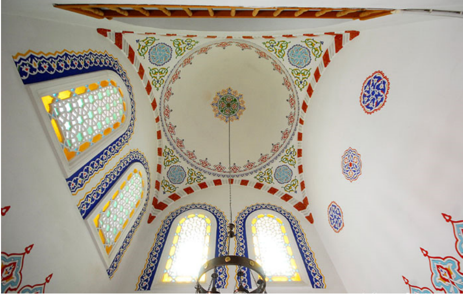
Fotoğraf 14: Hafız Ahmet Paşa Camii'nin Yan Mekanlarından Birinin Kubbesi