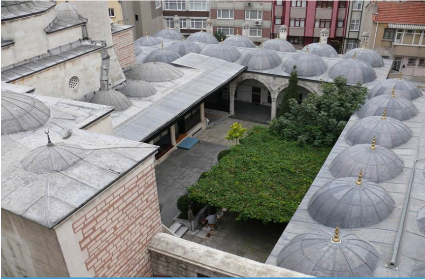
Fotoğraf 6: Hafız Ahmet Paşa Camii'nin Medrese Odalarıyla Çevrili Avlusu