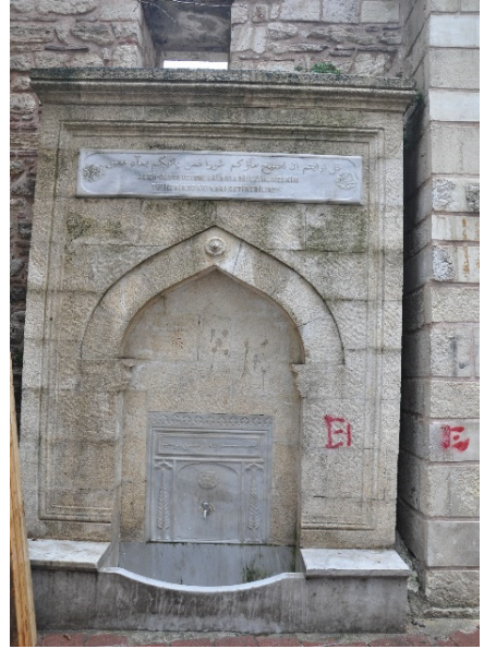
Fotoğraf 16: Hafız Ahmet Paşa Camii'nin Sokağa Bakan Duvarında Yer Alan Çeşme 128