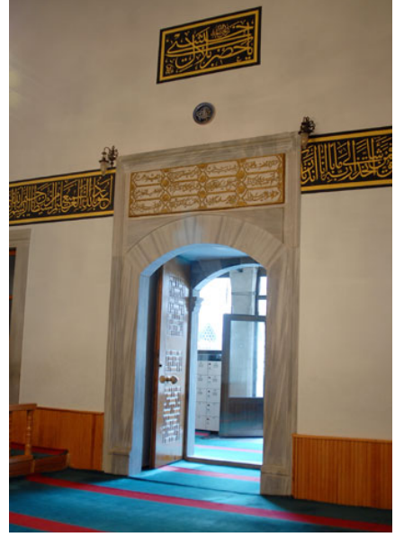
Fotoğraf 9: Hafız Ahmet Paşa Camii'nin Cümle Kapısının İç Mekândan Görünüşü