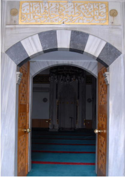
Fotoğraf 8: Hafız Ahmet Paşa Camii'nin Harimine Açılan Cümle Kapısı