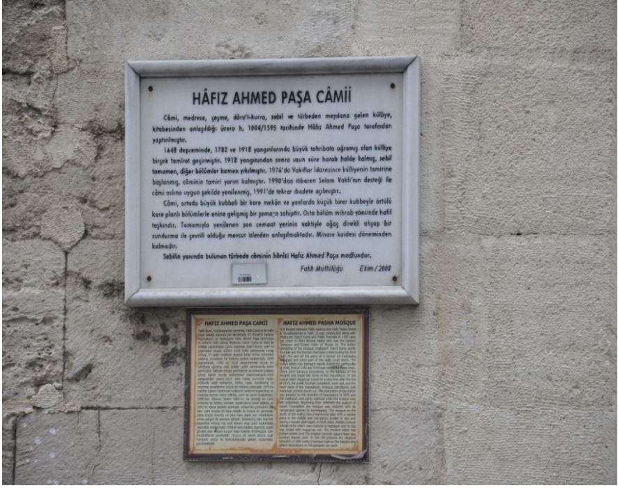
Fotoğraf 3: Hafız Ahmed Paşa Külliyesi'nin Kısa Tarihçesini İçeren Tabelaları